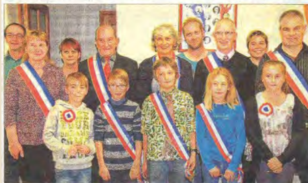
Les cinq membres du nouveau conseil municipal jeunes travailleront avec leurs aînés pour améliorer le quotidien des enfants du village.

Vendredi soir à la salle de la mairie, a été procédée à la remise officielle des écharpes aux nouveaux élus du premier conseil municipal jeunes de la commune.